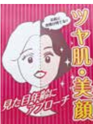
明るいスタッフが迎えてくれる