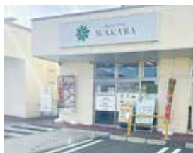
店舗前には大型駐車場あり

「旅行で買ったけどあまり使わなかった、プレゼントでもらったけど開けていない、憧れの女優さんの影響で買ったのだ