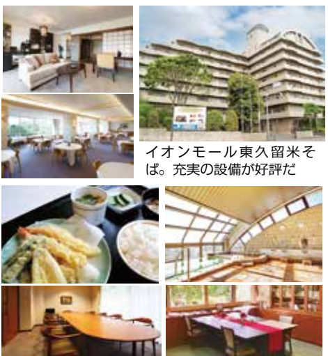
イオンモール東久留米そば。充実の設備が好評だ

「特に築年数の経った住宅の方は、ヒートショックなどが心配です。充実した設備と毎日同ホームでは、ヒノキ