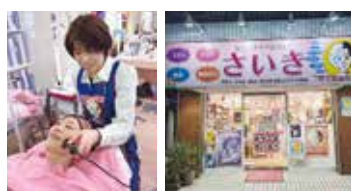
施術風景と外観。花小金井駅徒歩7分、駐車場完備。ファミリーマート前で分かりやすい

ビューティーショップさいき 042-464-2230 小平市花小金井6-31-6 定休：日曜・第3水曜午後 営業：10～20時 https://bs-saiki.com/