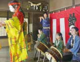
「鈴木ばやし」の保存を目的に、ネット上で実施するクラウドファンディングで、30日(水)が締切。保存会ホームページへの名前記載などの返礼品がある。

鈴木ばやしは、江戸時代末期に若者の娯楽として広まったもので、1970(昭和45)年には市の無形民俗文化財に指定されている。笛、かね、